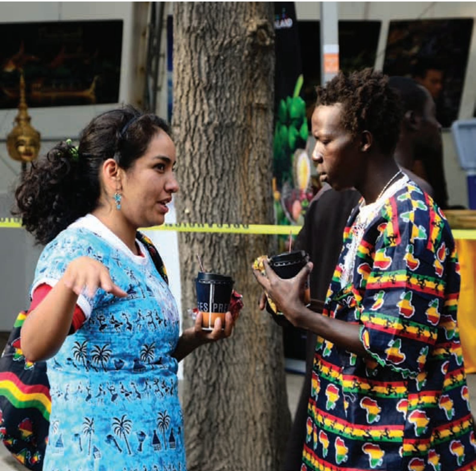
Ciudad de México, espacio intercultural