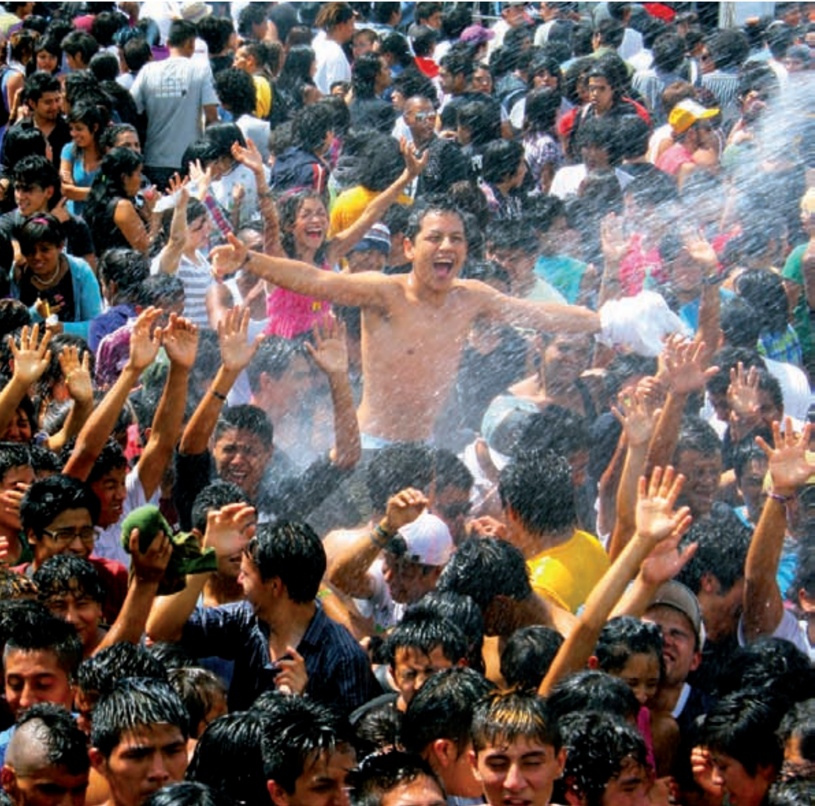
Exposición Rostros alegres de mi ciudad