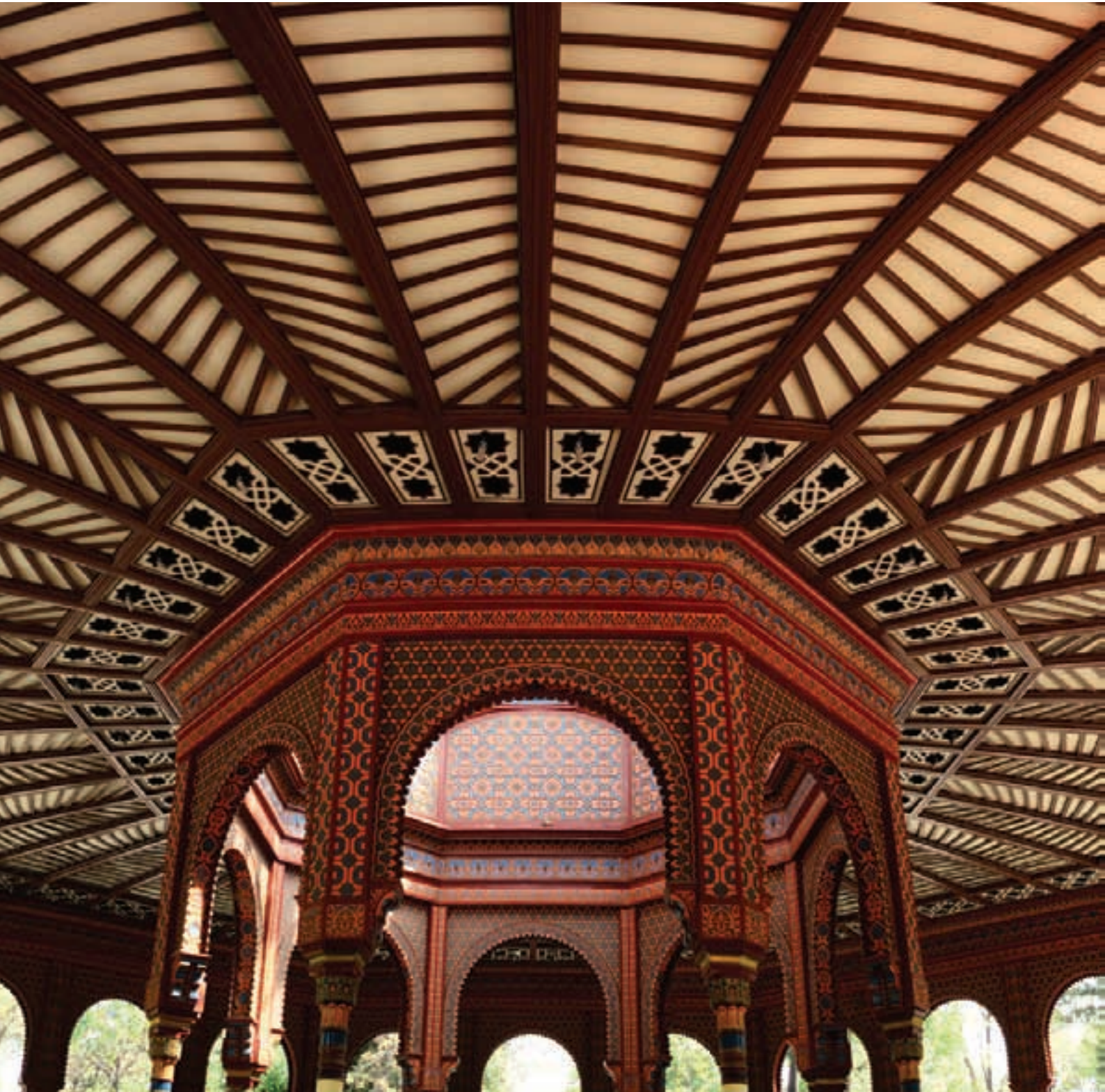
Detalle del techo del Kiosko Morisco, Santa María la Ribera